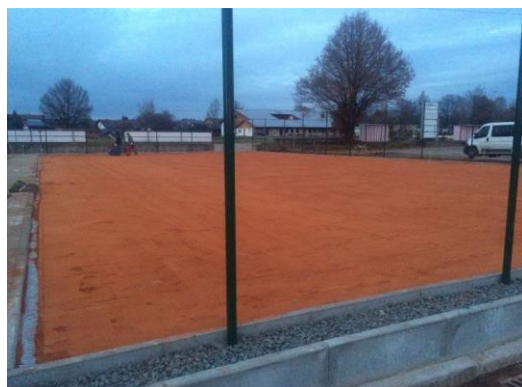
Abbildung 2 Abbildung 2 Facebookseite TSV Dietmannsried Abt. Tennis